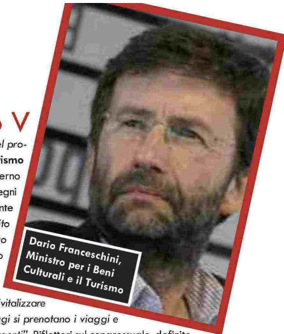
Dario Franceschini, Ministro per i Beni Culturali e il Turismo

una miniera: “Ho apprezzato molto il progetto del Convention Bureau Nazionale fatto dai privati, perché rompe un altro tabù che non ha più ragione d'essere, che ha impedito sino a ora una giusta integrazione tra pubblico e privato”. Per concludere, una promessa: “Il turismo sarà centrale nella gestione del governo Renzi. Credo che non ci sia nulla di più importante per la crescita del nostro Paese che investire su ciò che rende l'Italia unica nel mondo globale, in cui scompaiono le differenze, le distanze e le frontiere e in cui ogni economia nazionale deve investire sui propri punti di forza”.