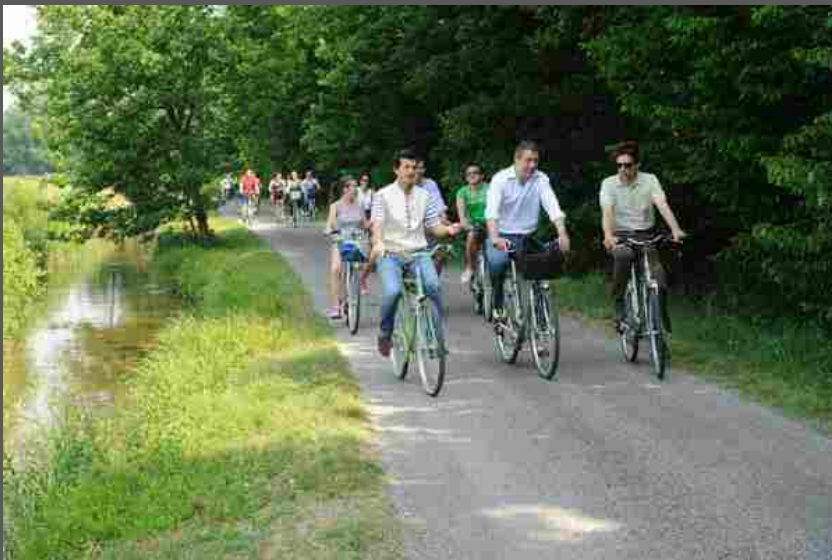
Turisti sempre più green, con la speranza di Expo Ogm Free

Dai cibi bio e a km zero ai pannelli fotovoltaici, dalla raccolta differenziata al risparmio idrico ed elettrico. E la speranza di un Expo dell'agricoltura sostenibile e Ogm Free. Il turismo è sempre più verde e sostenibile anche in Italia, che mette in luce le bellezze del territorio con l'imperativo categorico del rispetto e della preservazione.